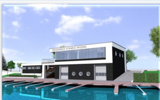
Wizualizacja budynku sportów wodnych (projekt ujęty w Strategii OPPT Powiatu Inowrocławskiego)