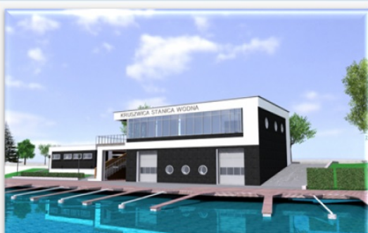
Wizualizacja budynku sportów wodnych (projekt ujęty w Strategii OPPT Powiatu Inowrocławskiego)