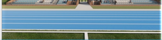
Wizualizacja stadionu sportowego