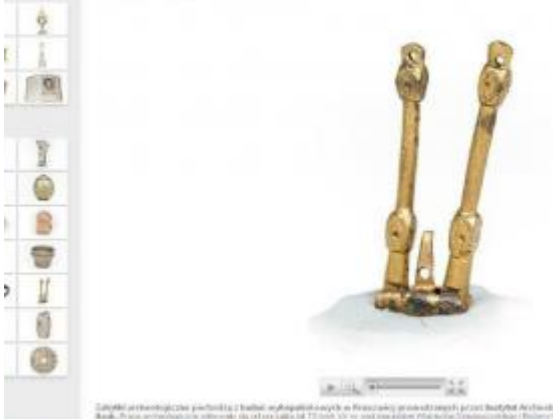
Złoty archeologiczny przedmiot z metalu wykopany w Pruszczu przy okazji prac przy budowie Archidiecezjalnego Banku. Pochodzi z okoliczności datowanych na 12 wiek. Wzrost: 10 cm. Waga: 100 g. Miejsce znalezienia: Pruszcz Gdański, Dział 10/1.