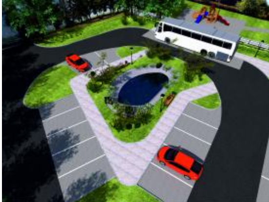
finansowane przez Unię Europejską ze środków Europejskiego Funduszu Rozwoju Regionalnego w ramach Regionalnego Programu Operacyjnego Województwa Lubuskiego na lata 2014-2020 w ramach projektu pn. Przebudowa 2 - rekreacyjnych w Chelmech i Polanowicach.