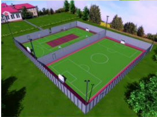
finansowane przez Unię Europejską ze środków Europejskiego Funduszu Rozwoju Regionalnego w ramach Regionalnego Programu Operacyjnego Województwa Kujawsko-Pomorskiego na lata 2014-2020 w ramach projektu pn. Przebudowa 2 - rekreacyjnych w Chelmech i Polanowicach.