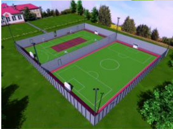
finansowane przez Unię Europejską ze środków Europejskiego Funduszu Rozwoju Regionalnego w ramach Regionalnego Programu Operacyjnego Województwa Kujawsko-Pomorskiego na lata 2014-2020 w ramach projektu pn. Przebudowa 2 - rekreacyjnych w Chelmniech i Polanowicach.