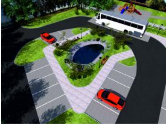
finansowane przez Unię Europejską ze środków Europejskiego Funduszu Rozwoju Regionalnego w ramach Regionalnego Programu Operacyjnego Województwa Lubuskiego na lata 2014-2020 w ramach projektu pn. Przebudowa 2 - rekreacyjnych w Chelmech i Polanowicach.