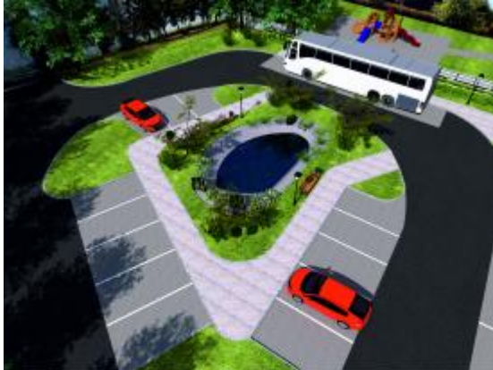
finansowane przez Unię Europejską ze środków Europejskiego Funduszu Rozwoju Regionalnego w ramach Regionalnego Programu Operacyjnego Województwa Lubelskiego na lata 2014-2020 w ramach projektu pn. Przebudowa 2 - rekreacyjnych w Chelmniech i Polanowicach.