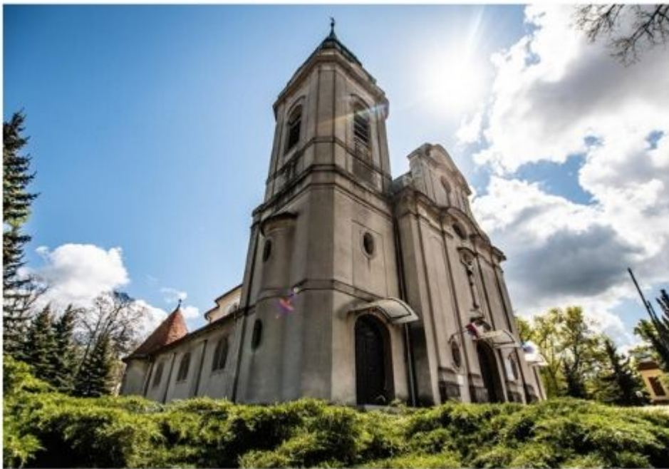
Kościół p.w. święcia św. Jana Chrzciciela w Piaskach