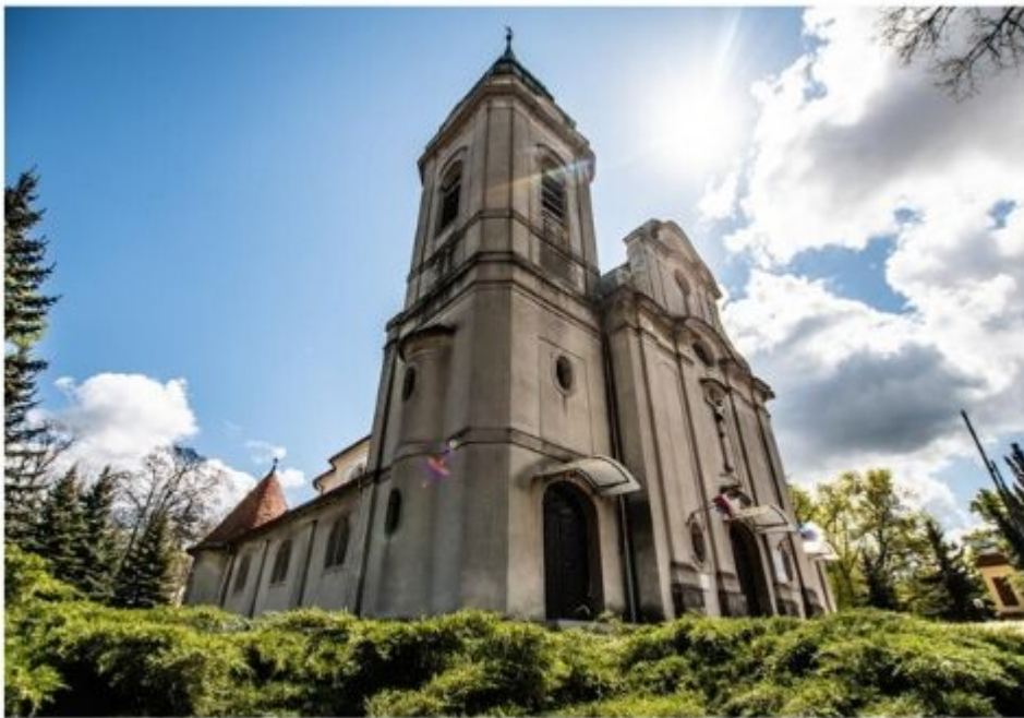
Kościół p.w. ściegicia św. Jana Chrzciciela w Piaskach