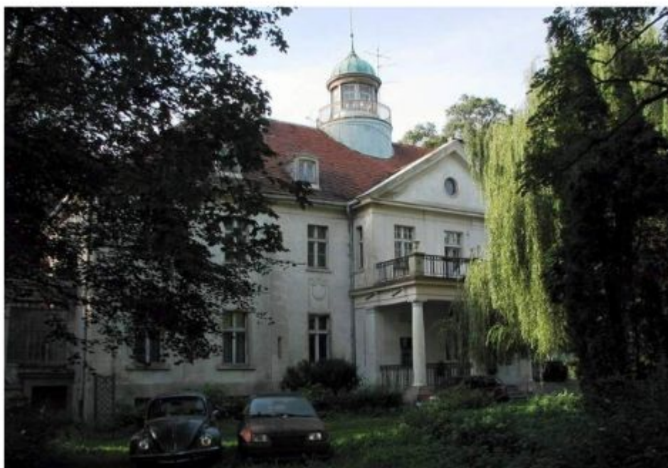
Pałac w Polanowicach,

http://www.polskiezabytki.pl/m/obiekt/1251/Polanowice/