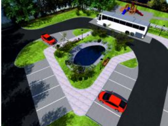
finansowane przez Unię Europejską ze środków Europejskiego Funduszu Rozwoju Regionalnego w ramach Regionalnego Programu Operacyjnego Województwa Lubelskiego na lata 2014-2020 w ramach projektu pn. Przebudowa 2 - rekreacyjnych w Chelmnie i Polanowicach.