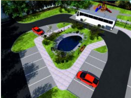
finansowane przez Unię Europejską ze środków Europejskiego Funduszu Rozwoju Regionalnego w ramach Regionalnego Programu Operacyjnego Województwa Lubelskiego na lata 2014-2020 w ramach projektu pn. Przebudowa 2 - rekreacyjnych w Chelmnie i Polanowicach.