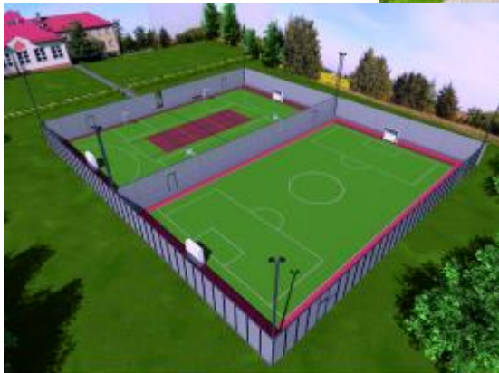
finansowane przez Unię Europejską ze środków Europejskiego Funduszu Rozwoju Regionalnego w ramach Regionalnego Programu Operacyjnego Województwa Kujawsko-Pomorskiego na lata 2014-2020 w ramach projektu pn. Przebudowa 2 - rekreacyjnych w Chelmnie i Polanowicach.