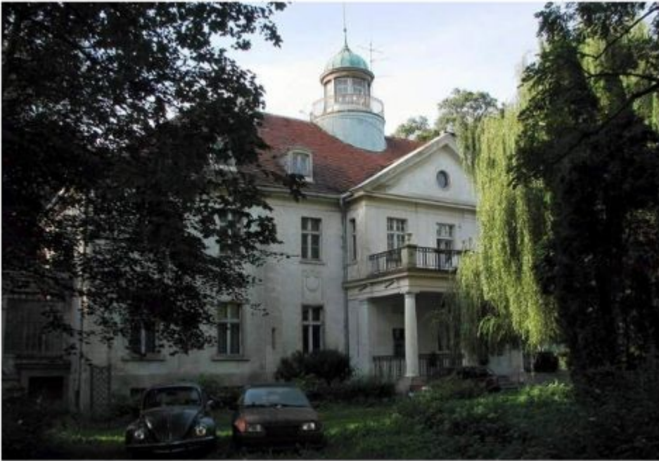
Pałac w Polanowicach,

http://www.polskiezabytki.pl/m/obiekt/1251/Polanowice/