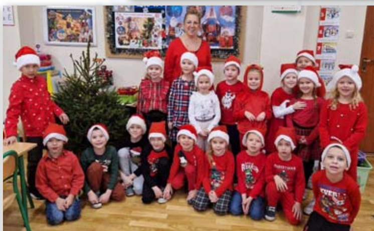
Szkoła Podstawowa Nr 1