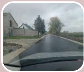
Droga w Bachorcach po przebudowie