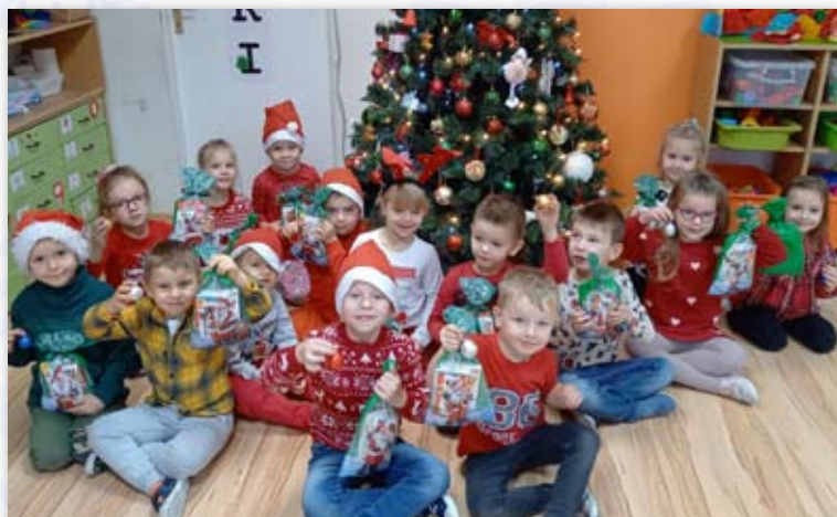
Przedszkole Samorządowe Nr 1

W dniu 6 grudnia 2022 r. w wielu placówkach na terenie naszej gminy odbyły się zabawy mikołajkowe.