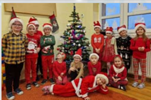
Szkoła Podstawowa Nr 2