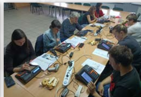
Zajęcia w ramach kursu sprzedawca