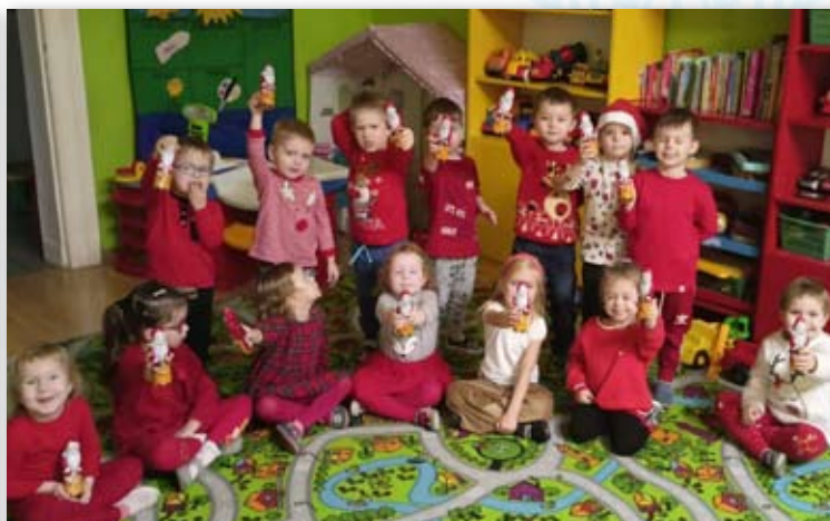
Przedszkole Samorządowe Nr 3