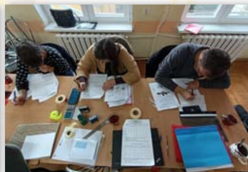
Zajęcia w ramach kursu pracownik biurowy

Gmina Kruszwica otrzymała dofinansowanie z Europejskiego Funduszu Społecznego w ramach Osi priorytetowej 9. Solidarne społeczeństwo, Działania 9.2. Włączenie społeczne, Poddziałanie 9.2.1. Aktywne włączenie społeczne Regionalnego Programu Operacyjnego Województwa Kujawsko-Pomorskiego na lata 2014–2020 na realizację projektu w wysokości 1 273 656,76 zł.