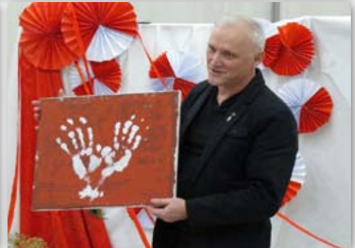
Miejsko-Gminna Biblioteka Publiczna, Nadgoplańskie Towarzystwo Historyczne oraz Centrum Kultury i Sportu „Ziemowit”.