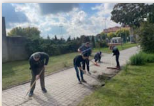
Zajęcia w ramach kursu pracownik gospodarczy