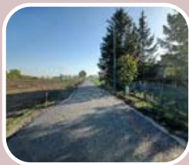
Droga w Baranowie po przebudowie