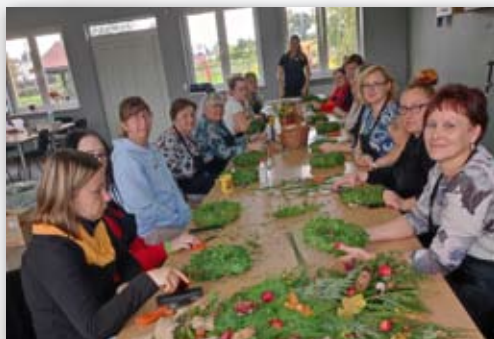
Zajęcia w ramach kursu florysta

Działania realizowane w ramach projektu będą kontynuowane również w 2023 roku. Serdecznie zapraszamy zainteresowane osoby do Urzędu Miejskiego w Kruszwicy (pok. 113 i 114) lub do biura LGD Czarnoziem na Soli po szczegółowe informacje dotyczące projektu.