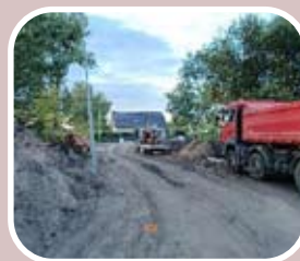
ulica Mickiewicza w Kruszwicy w trakcie przebudowy