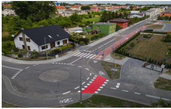
ulica Mickiewicza w Kruszwicy po przebudowie