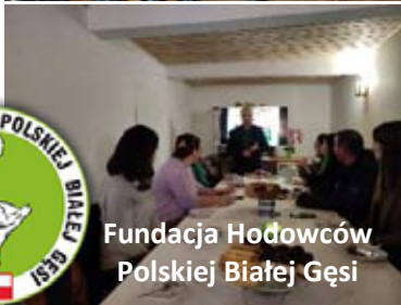
Fundacja Hodowców Polskiej Białej Gęsi