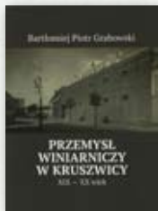
Bartłomiej Piotr Grabowski „Przemysł winiarniczy w Kruszwicy. XIX-XX wiek”.

Kruszwicka biblioteka pozyskała cztery nowe pozycje książkowe opisujące historię naszego miasta i regionu.